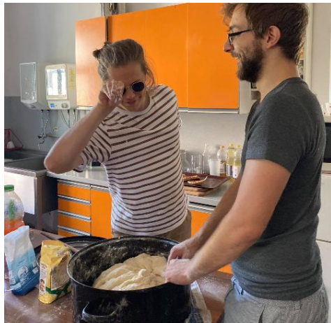
Legendární kuchařky M+M nahrazujeme svépomocí...