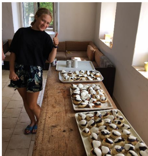
...ale za výsledky se nemusíme stydět