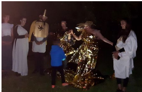
Malí Odysseové v zemi Fajáků