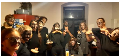
...se vyklubali obětavi vedoucí