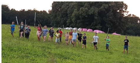
Poslední bitva tentokrát vzplála na Ithace