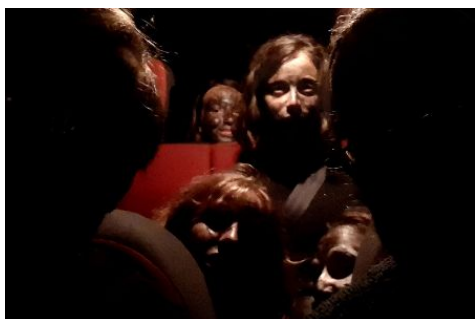
Ze zombiků ve farářově autě...